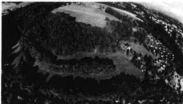
1. Vue aérienne actuelle du vallon de la Valleyre.

Il s'étend sur une superficie de 54 467 m 2 , dont environ 47 000 m 2 réaffectés en zone constructible. Il s'appuie sur le Plan Général d'Affectation approuvé en 1993 et a été validé en 2006, en se fondant sur une constatation des limites forestières établie en 1997.