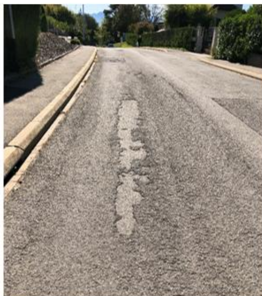
Revêtement usé et présence de pelades

Plutôt que de réfectionner cet axe dans sa géométrie actuelle, la Municipalité a pris la décision de réaménager la chaussée afin de modérer le trafic et d'améliorer le confort des piétons.