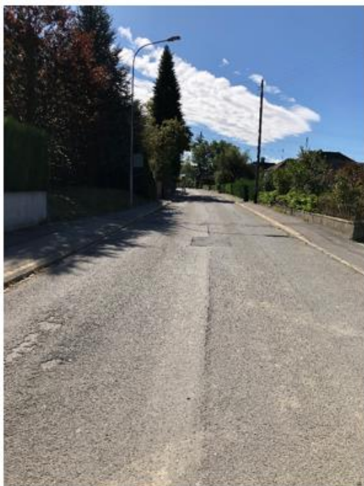
Vue direction ch. du Verger

Depuis plusieurs années, l'état du revêtement bitumineux de la chaussée est fortement dégradé et nécessite une réfection totale (longueur : 340 m et surface totale DP : 3'000 m 2 ). Le nombre et le type de véhicules qui empruntent la route des Martines expliquent en partie l'état dégradé de la chaussée (présence de fissures longitudinales, transversales et nids de poules/pelades).