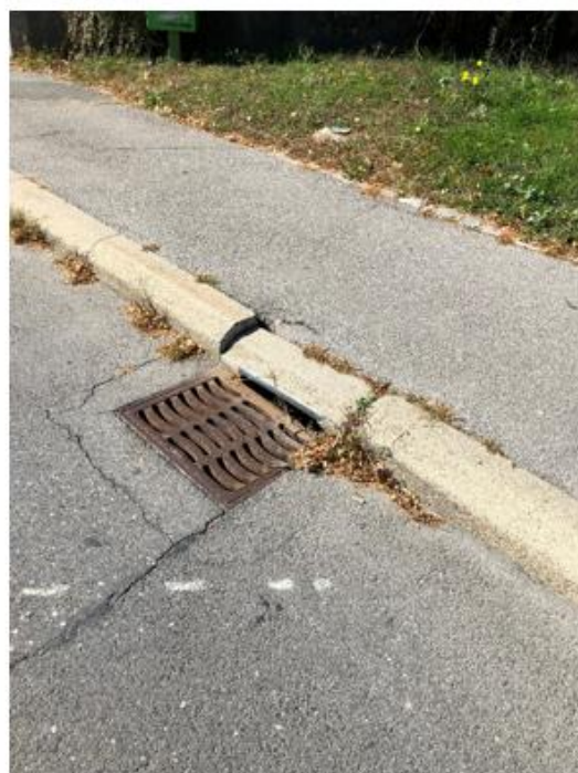
Bordure de trottoir abîmée