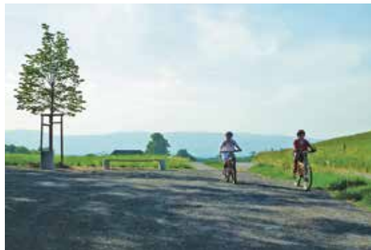
Route de Manlout.

La desserte des zones périphériques par des chemins combinés avec des itinéraires de randonnée figure au plan directeur «réseau piétons». Deux exemples de réalisation peuvent être mis en évidence.