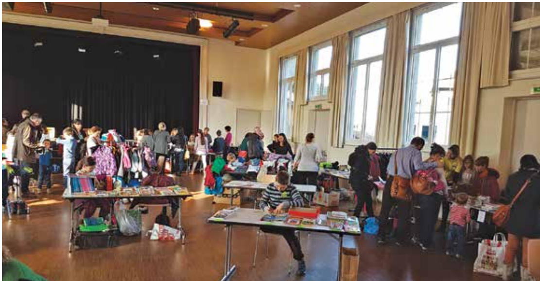
Foire aux livres.