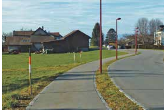
Route du Jorat.