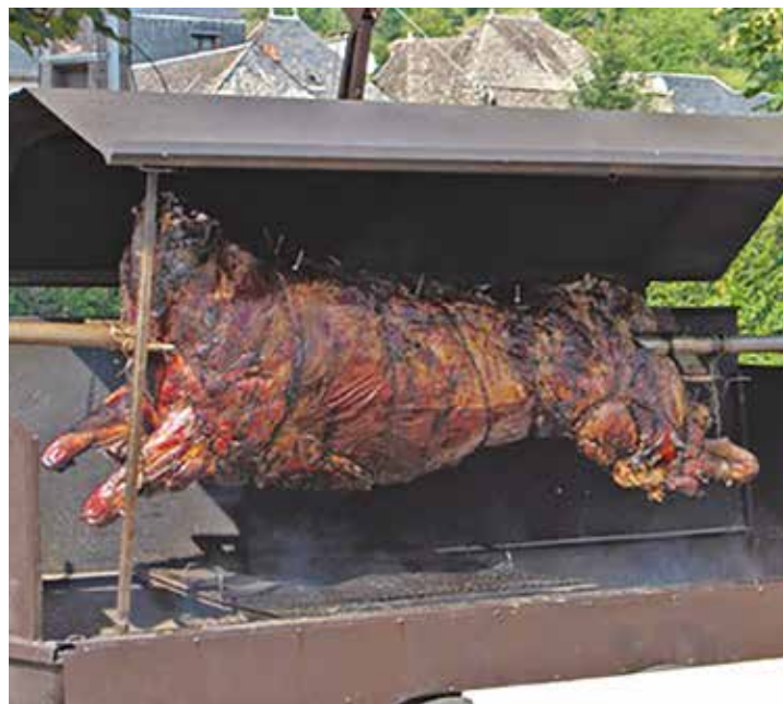
Un bœuf sur le feu...