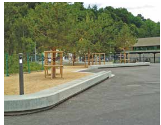
... au Mottier.