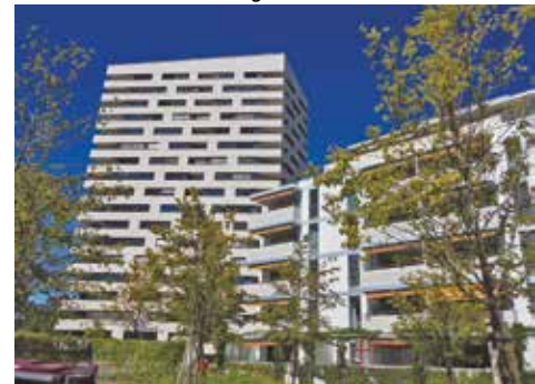
La partie lausannoise dans son écrin de verdure.