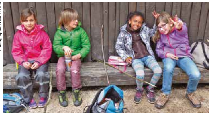
Le culte de l'enfance en sortie.