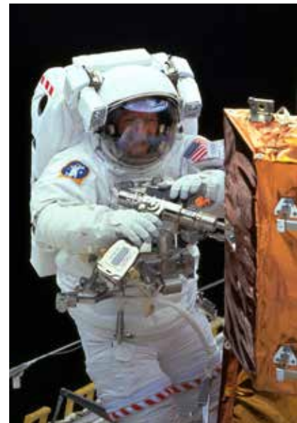
Claude Nicollier répare Hubble.