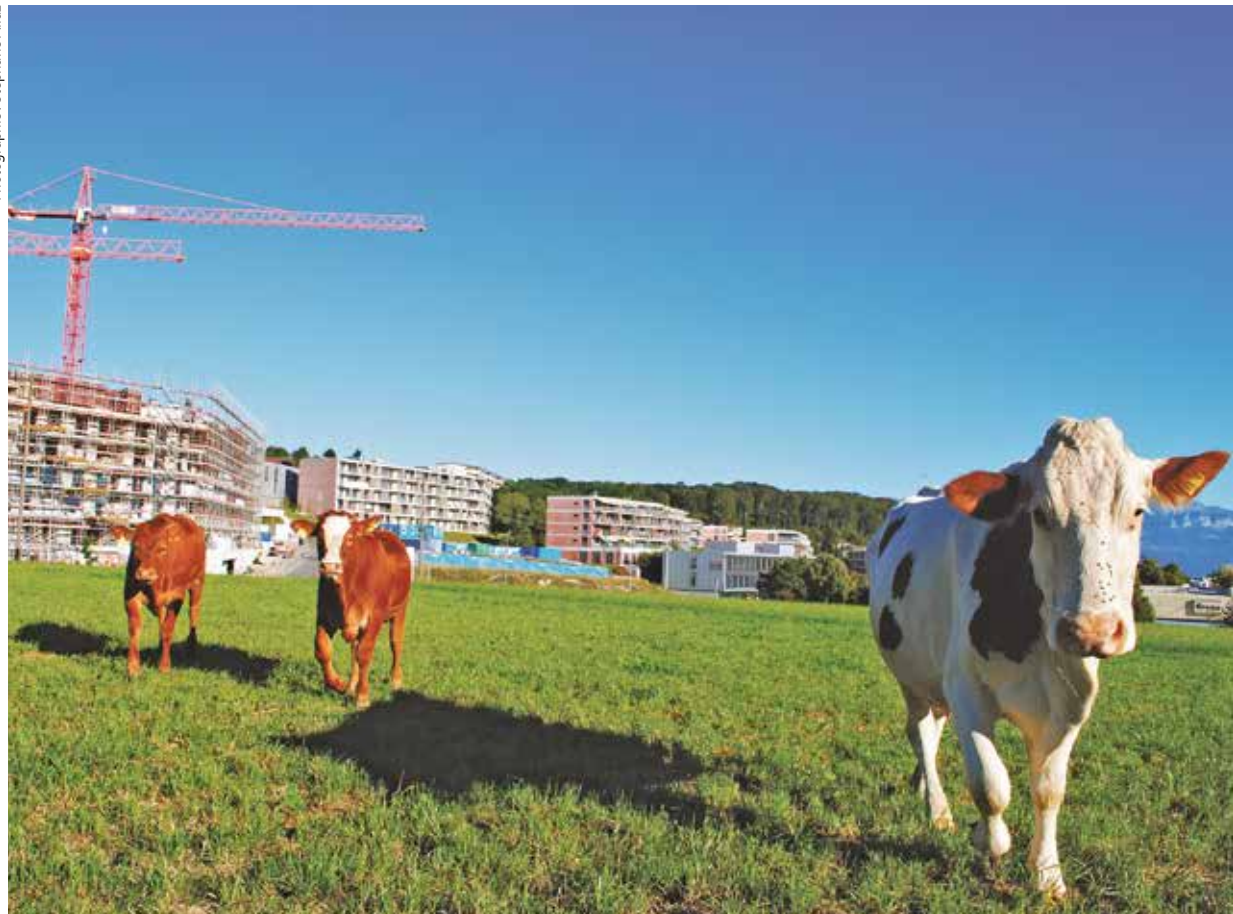
« Le Mont, une ville »... à la campagne.